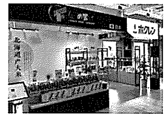
虹橋輸入商品提示交易中心内小売店「匠の饗宴」

※ECサイトのURLアドレスは北海道経済部国際経済室のホームページからご参照ください。