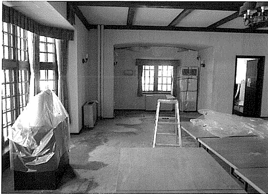
知事公館 1階 食堂 (令和3年1月6日撮影)