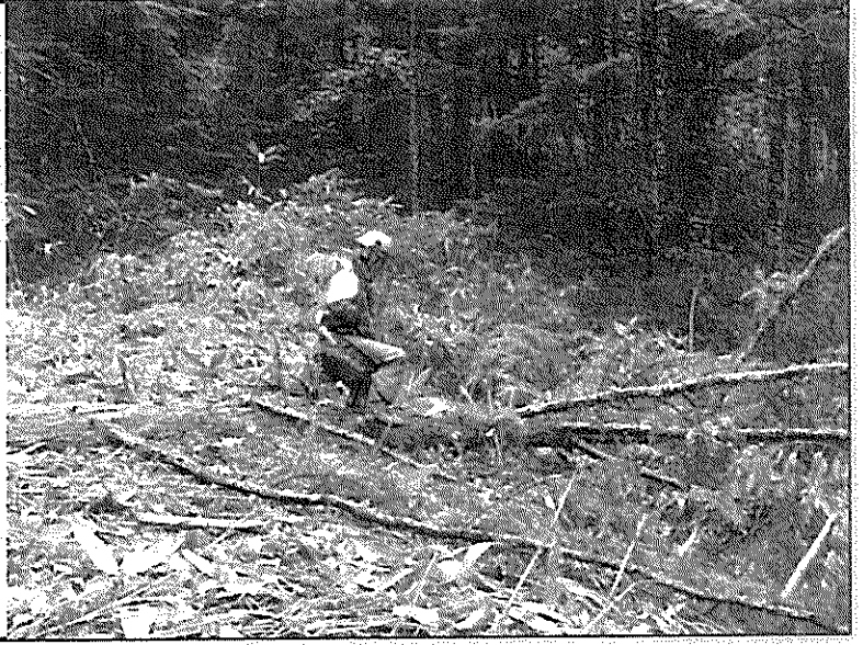
【学生の部】 野外ゲーセン

〈撮影者コメント〉 チェーンソーを初めて握る人に 伐倒の指導を行いました。 〈撮影者コメント〉 どんな仕事もコツコツと。