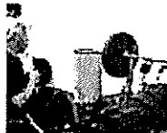
高い指導力 世界レベル・日本代表クラスのトップコーチ陣が直接指導

第1(エントリー)・第2(基礎測定・専門測定)ステージを経て、第3(検証)ステージに進むアスリートを選出。合宿やトレーニング等の検証プログラムを実施し、各中央競技団体の強化・育成コースの選手を目指します。