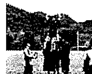
競技団体のユース選抜や育成・強化選手に選出