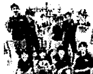
仲間ができる 全国の仲間・ライバルと切磋琢磨