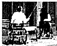
練習環境が充実 日本代表選手と同じ練習場所(NTC等)が使えることも!