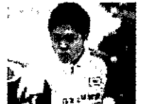
オリンピック・パラリンピックに出場する可能性をもつ選手

第1(エントリー)・第2(基礎測定・専門測定)ステージを経て、第3(検証)ステージに進むアスリートを選出。合宿やトレーニング等の検証プログラムを実施し、各中央競技団体の強化・育成コースの選手を目指します。