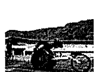
費用面のサポートも 練習に必要な用具等の購入、合宿旅費などサポート。