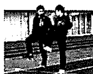
初心者でもOK 1年で競技団体の強化・育成コースに進出した選手も!