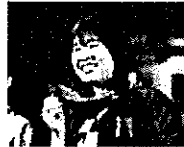
世界大会・全日本大会等に出場

J-STAR修了後有望選手は、各中央競技団体の強化・育成コースに選出。大会への参加はもちろん、世界で活躍できるアスリートを目指すためのプログラムが実施されます。