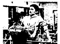
合宿トレーニング 月1回程度の合宿を実施。日々の居住地トレーニングもサポート