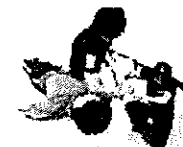
充実のサポート体制 競技団体スタッフによる運搬サポート