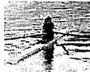
JOCエリートアカデミーに入校