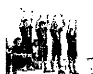
大会出場を狙う 選手として世界大会・全国大会出場を目指してトレーニング