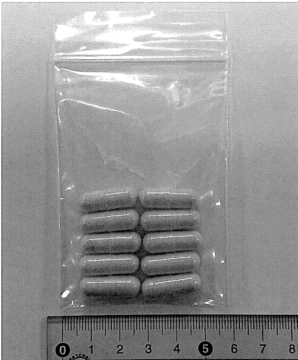
包装及び内容物(カプセル) (注:外装なし)