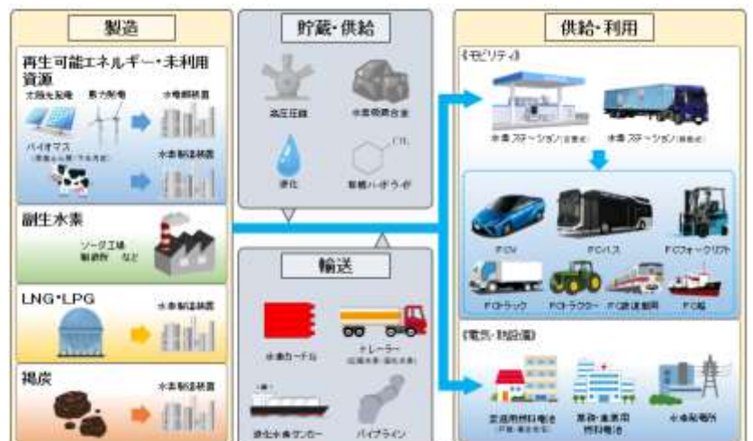
【2040 年度頃のサプライチェーンのイメージ】