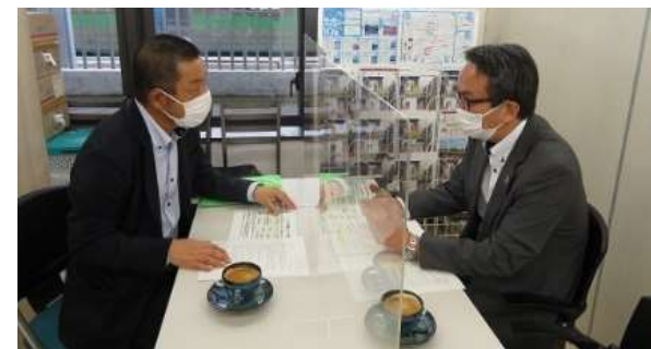
イベント再開に向けた留意事項等の周知（観光協会）