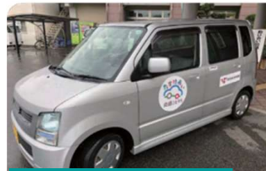
▲(株)未来シェアの実証実験車両