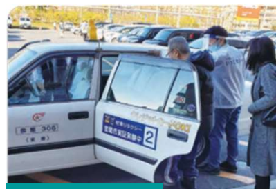
企業連携による実証