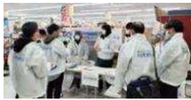
▲室蘭MaaSプロジェクト