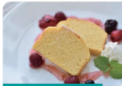
オカラ発酵物から試作したケーキ