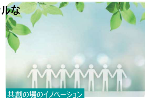
共創の場のイノベーション