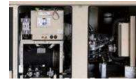
▲マルチ燃料エンジン