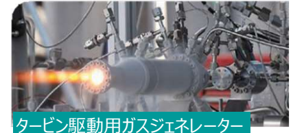
タービン駆動用ガスジェネレーター