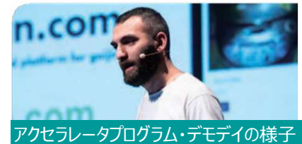
アクセラレータプログラム・デモデイの様子