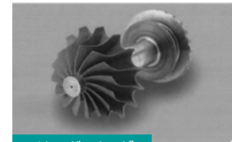
マイクロガスタービン