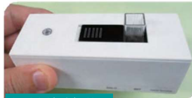
小型土壌分析装置

北海道の基幹産業である農林水産業や食関連産業等では労働力の確保が課題となっています。AI、IoT、ロボットなどの先端技術や他分野との技術融合により、生産性の向上や物流の効率化などを進めます。