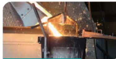
スクラップ鋼材の再利用