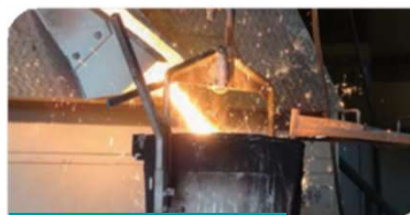
スクラップ鋼材の再利用