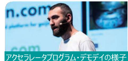
アクセラレータプログラム・デモデイの様子