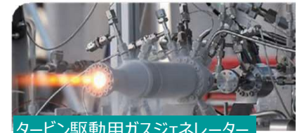
タービン駆動用ガスジェネレーター