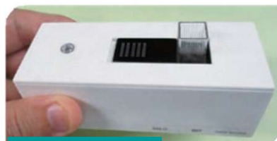
小型土壌分析装置

北海道の基幹産業である農林水産業や食関連産業等では労働力の確保が課題となっています。AI、IoT、ロボットなどの先端技術や他分野との技術融合により、生産性の向上や物流の効率化などを進めます。