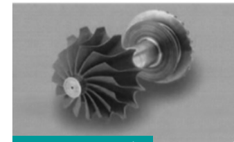
マイクロガスタービン