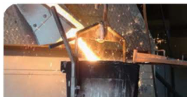
スクラップ鋼材の再利用