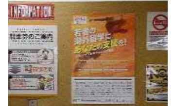
(株)太陽グループ様