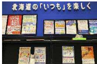
サツドラホールディングス(株)様