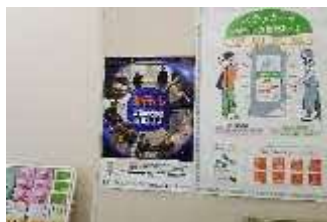
(株)ファミリーマート様