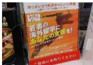
(株)セブンイレブン・ジャパン様