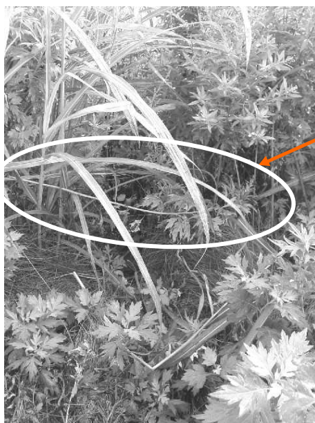
■ 出入り口に草を置く例