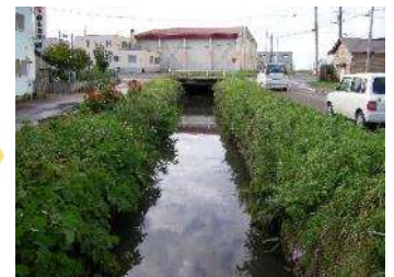
◇環境の改善（銭内（おもない）川）