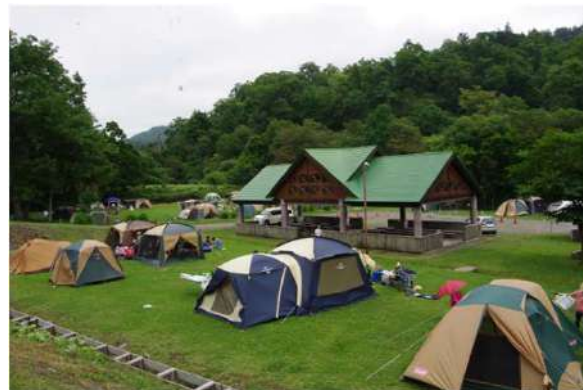
キャンプ場とBBQハウス