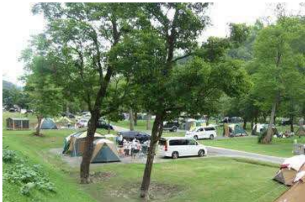
オートキャンプ場