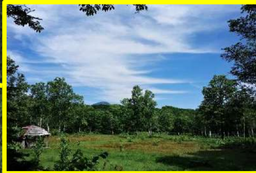
パークゴルフ場跡地