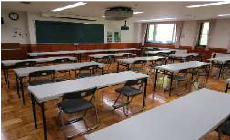
研修室（ワークスペース候補）