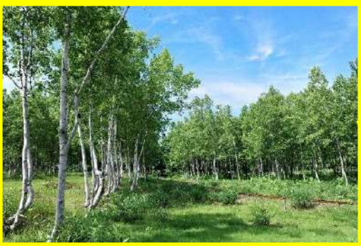
トロッコ施設跡地