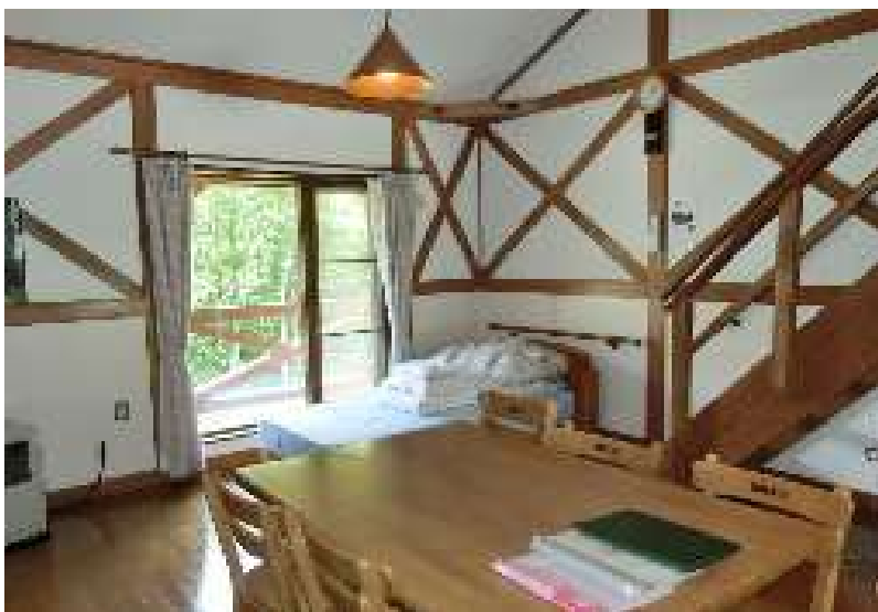
宿泊施設（コテージ）室内（ワークスペース候補）