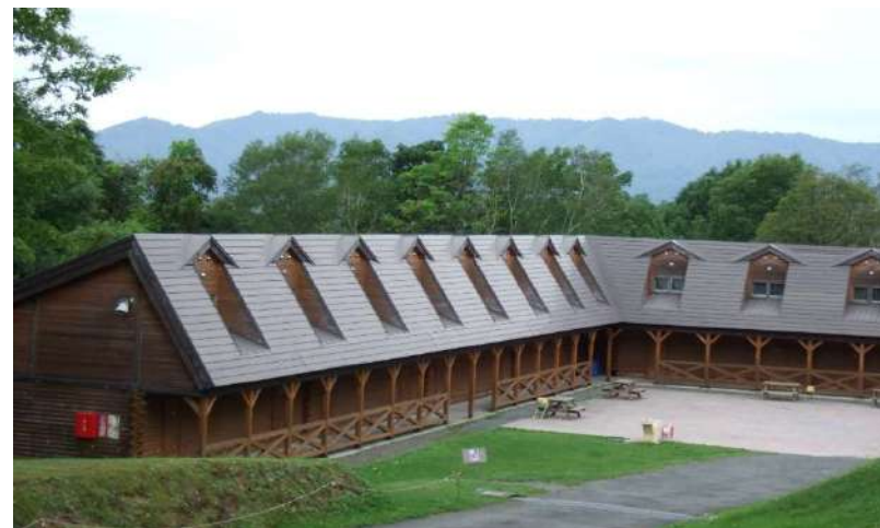
宿泊施設（コテージ）全景