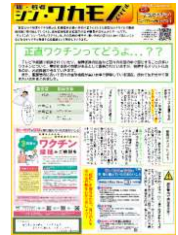
<若者向け「かわら版」>

通学によく利用されるバスを中心に、 苫小牧市・室蘭市内の運行バスの他、 規模が大きい停留所への掲載