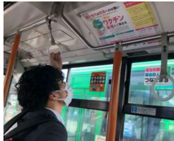
<バス車内広告(道南バス・あつまバス)>

通学によく利用されるバスを中心に、 苫小牧市・室蘭市内の運行バスの他、 規模が大きい停留所への掲載