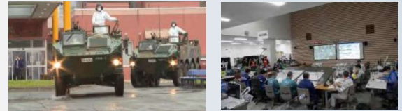
北海道原子力防災訓練