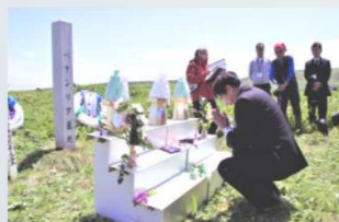
北方墓参(令和元年)