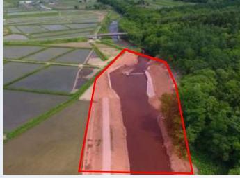
河道掘削・堤防の整備状況