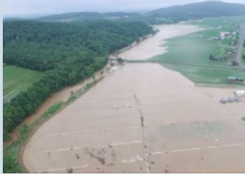
ペーパン川の浸水被害 (平成30年7月 旭川市)