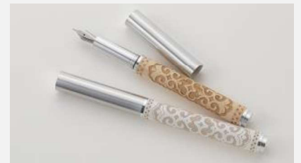
デザイナーとのコラボによる アイヌ工芸品の商品開発(平取町)