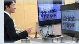
情報技術支援員（ICT支援員）の配置