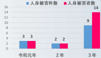
ヒグマによる人身被害

豊かな水資源の保全に向けた取組の推進 野生鳥獣被害対策の推進 ヒグマによる人身及び農業被害対策の推進 原子力発電所の安全対策及び原子力防災対策の徹底 高レベル放射性廃棄物に係る最終処分事業の全国での理解促進等 災害や犯罪から道民を守るための警察機能の充実・強化 国際情勢を踏まえた万全な危機対応・北朝鮮拉致問題の早期解決 ロシア軍の活動に対する警戒監視及び防衛体制の強化