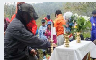
自由訪問(令和元年)