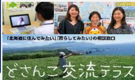
移住相談実施 (オンライン・対面)