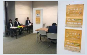
北海道U・Iターンフェア