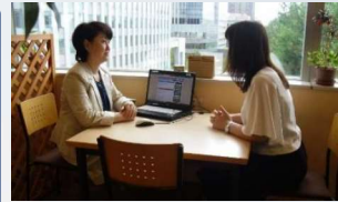
ジョブカフェ北海道

多様な人材の活躍と働き方改革の推進 中小・小規模企業の振興、地域商業の活性化 中小・小規模企業等の資金繰りを支援するための金融対策の一層の充実 外国人材の円滑な受入れと共生に向けた環境整備