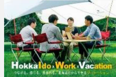
ポータルサイト・各種SNSでの 情報発信