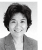
元埼玉県議 おくだ 智子