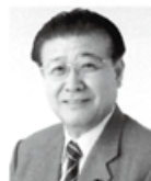
参院議員 市田 忠義

1942年、大阪府生まれ。立命館大学卒。参院3期。党国會議員団長。参院議員団長。