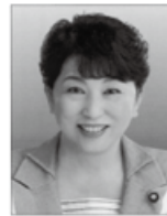
ふくしま 福島 みずほ [所属] 参院議員、弁護士、元内閣府特命担当大臣 [政策・得意分野] 平和、女性、人権、脱原発、雇用、経済、大規模給付ゼロ