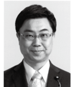
こうそう あきの 公造 現 党参院政策審議団副会長、参院議員1期、長崎大学大学院修了、48歳。 明日の「健康ニッポン」を造る。