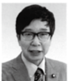
参院議員 大門みき