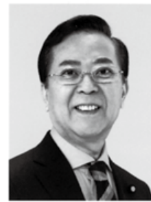
よこやま 信一 現 元農林水産大臣政務官、参院議員1期、北海道大学大学院博士課程単位取得、56歳。 “地方創生”で未来を創る。実現力の男。