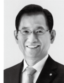
はまだ 浜田 まさよし 現 前復興副大臣、参院議員2期、京都大学卒、59歳。 あなたの声、活かす力!