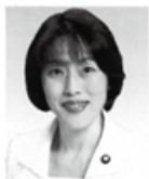
参院議員 田村 智子