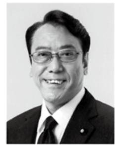
ながさき ひろあき 現 参院災害対策特別委員長、参院議員1期、東洋大学卒、57歳。 庶民とともに行く。