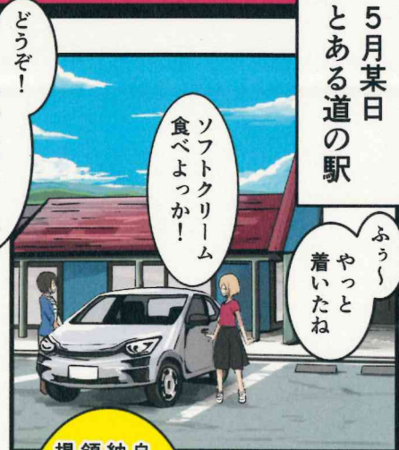
自動車税種別割 領収証書