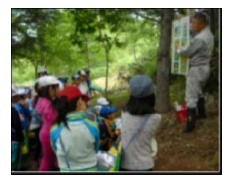
森林や木材とのふれあいの機会の確保