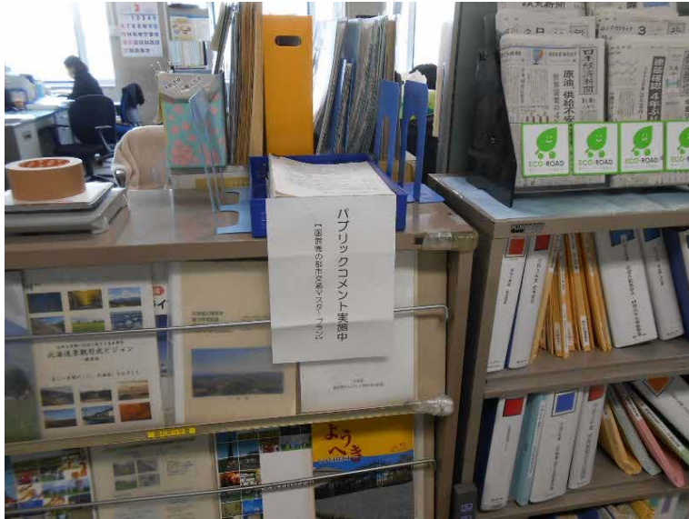
〔北海道都市計画課〕