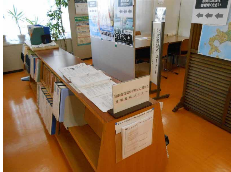
〔北海道総務部行政局文書課行政情報センター〕