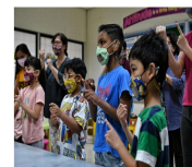
シンガポールの手話事情