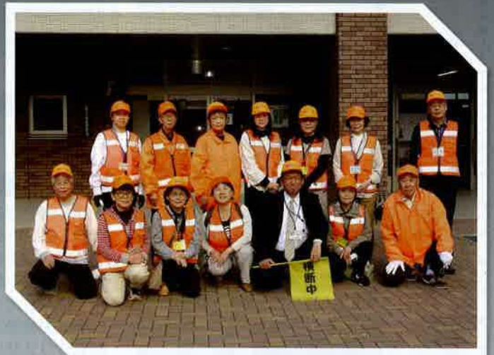
白石地区ネットワーク協議会「通学パトロール隊」(札幌市)