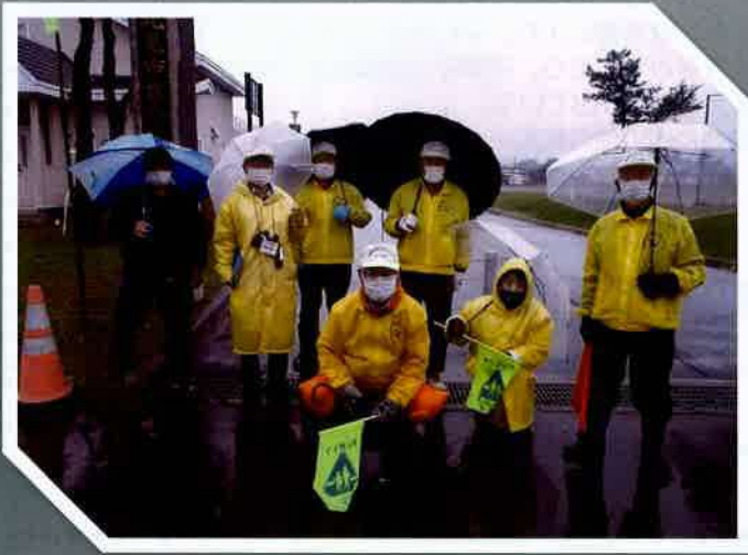
ときわ24防犯パトロール隊(北見市)