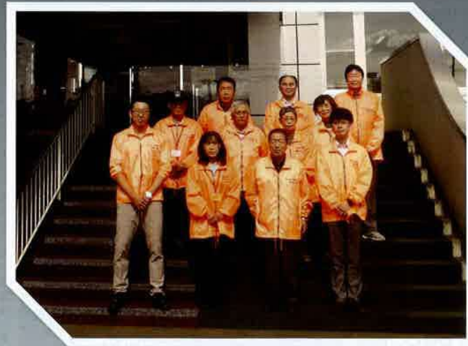
ふかがわ「すきやき隊」(深川市)