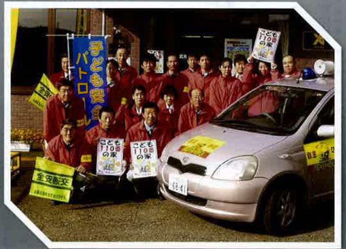
植村建設株式会社(赤平市)