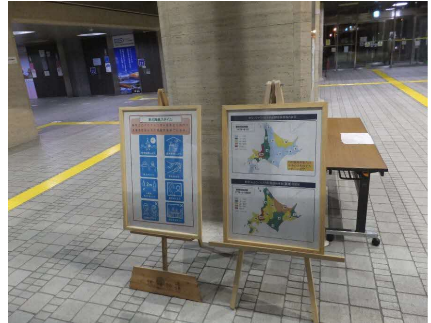
取組内容と感染者数等の掲示 (本庁舎ロビー)