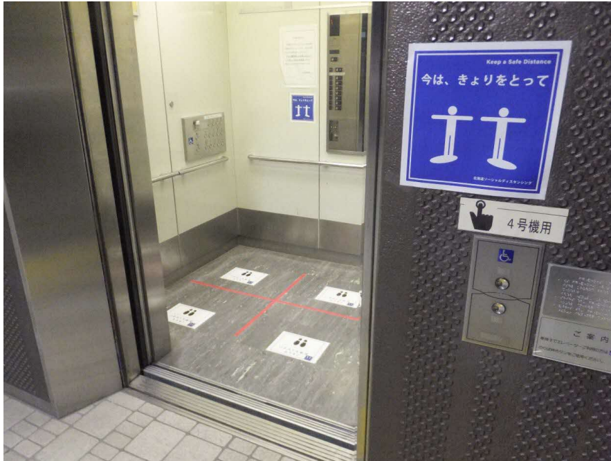
ソーシャルディスタンスの取組 (本庁舎エレベーター)