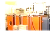
【チップボイラーでの熱利用】