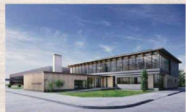
※新校舎イメージ(2021年完成)