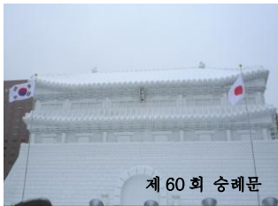
제 60 회 승례문

• 이벤트 행사 즐기기 스노보드 레저 점프대에서는 정교하고도 박력있는 묘기가 펼쳐지며 대형 설상 앞에 설치된 무대에서는 퀴즈대회, 음악 공연 등 밤낮으로 다양한 행사가 열립니다.