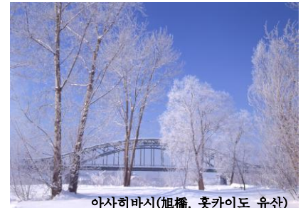
아사히마시(旭橋, 홋카이도 유산)