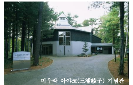
미우라 아야코(三浦綾子) 기념관