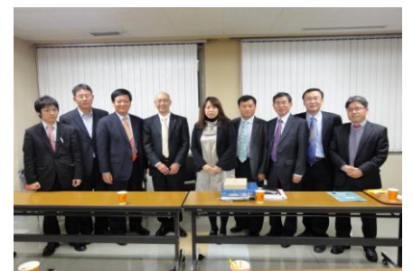
< 행정안전부·지자체 국외정책 연수단 >

홋카이도 측에서는 도청의 근무실적 평가 제도에 대해 설명한 뒤 양 지역의 제도를 비교해가며 질의응답의 시간을 갖었습니다.