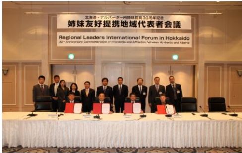
< 각 지역 공동성명 채택 >

회의에서는 각 지방정부의 공동과제인 '지속가능한 발전'에 중점을 두고, 각 지역 대표자가 환경과 조화를 이루며 지속가능한 발전을 위해 어떤 정책을 펼치고 있는지에 대해 의견을 교환했습니다.