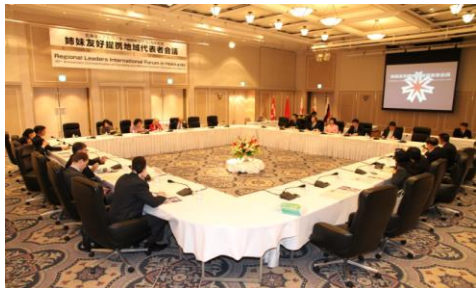
< 자매우호 제휴지역 대표자회의 모습 >

이번 회의를 통해서 각 지역은 온실가스 삭감, 자연환경 보전, 기후변화가 미치는 영향에 대처하기 위해서는 전 세계 개개인의 역할이 중요함과 함께 국제사회의 적극적인 협력이 필요함을 재확인하였습니다.