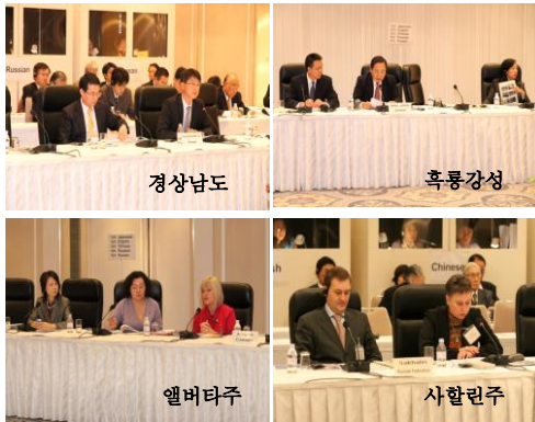
< 각 지역 대표단 >