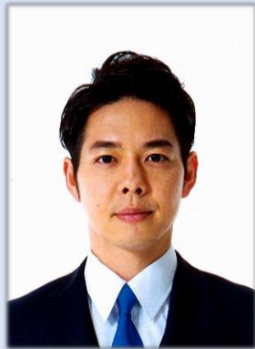
北海道知事 鈴木 直道

令和元年度北海道男女平等参画チャレンジ賞を受賞されたお二方、誠に おめでとうございます。