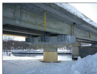
<対策例>桁下ブラケット、 橋脚巻き立て