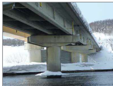
橋梁の耐震補強対策