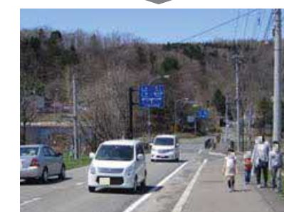
<対策例>歩道設置・通学路対策