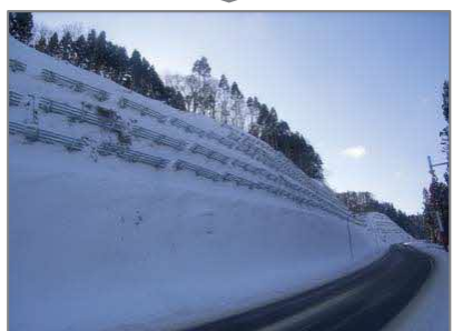
<対策例>雪崩予防柵