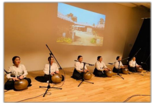
成功裏に開催された済州民謡公演