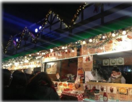
ミュンヘンクリスマス市 in Sapporo （2019.11.22～12.25）