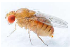
ゴマ粒ほどの大きさの昆虫