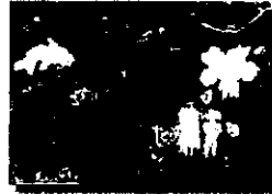
2020年度 優秀作品(小学生)