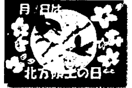
2020年度 最優秀作品(中学生)