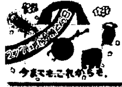
2020年度 最優秀作品(小学生)