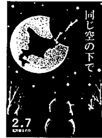
2020年度 最優秀作品(総合)

http://www.pref.hokkaido.lg.jp/sm/hrt/index.htm