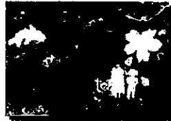
2020年度 優秀作品 (小学生)