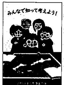
2020年度 優秀作品(高校の部)