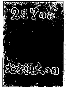
2020年度 最優秀作品(高校の部)