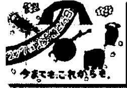
2020年度 最優秀作品 (小学生)