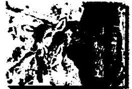
2020年度 優秀作品 (中学生)