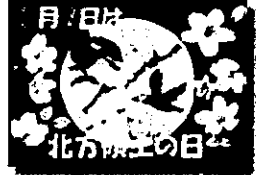
2020年度 最優秀作品 (中学生)