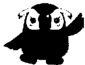
北方領土のイメージキャラクター エトピリカの「エリカちゃん」

募集期間 2021年5月21日(金) ~ 10月15日(金) 当日消印有効 応募資格 高校生以上 (プロ、アマは問いません)