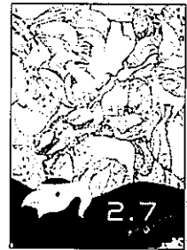
2020年度 最優秀作品(大学・専門学校の部)