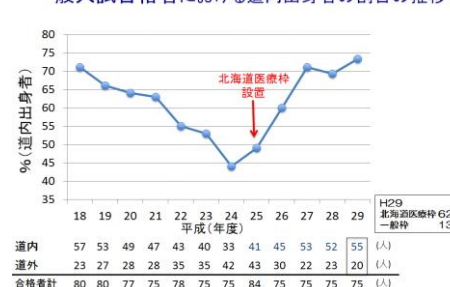
一般入試合格者における道内出身者の割合の推移