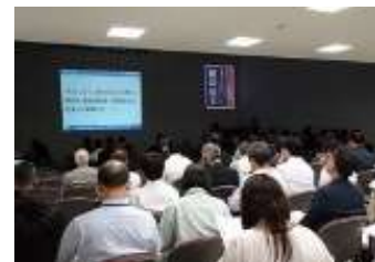
旭川産業創造プラザ成果発表会 新製品開発、海外販路開拓支援などを 担当者より発表