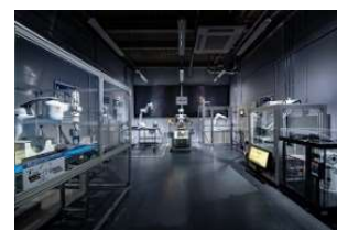
食品ロボット実証ラボ (ロボラボ)