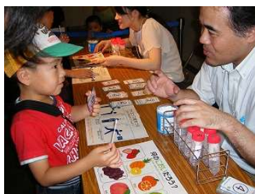
サイエンスパーク2018