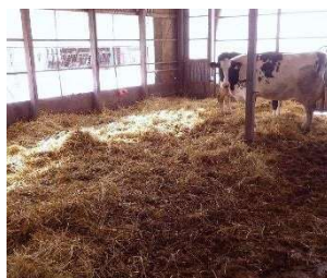
出産後の乳牛の疾病発生リスクを低減する飼養管理法の開発