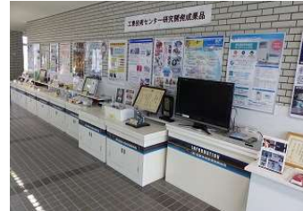
道立工業技術センターの研究開発成果品（ロビーにて展示）