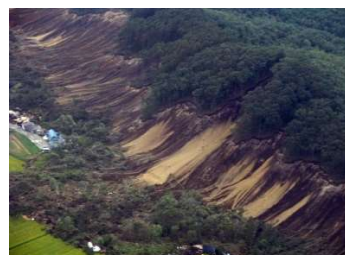
北海道胆振東部地震により発生した斜面災害の発生機構の解明