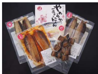
骨まで食べられる製造法による未低利用魚を活用した製品開発