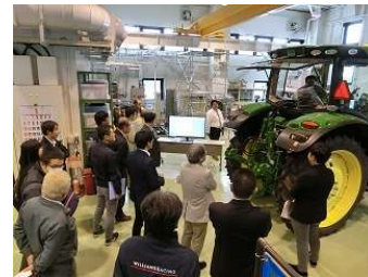
ISOBUS 普及推進会によるワークショップ