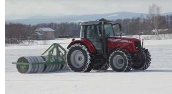
北見工業技術センターの技術支援による雪踏みローラーの開発