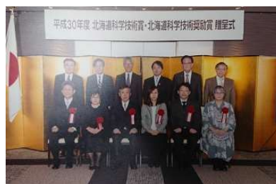
北海道科学技術賞及び 北海道科学技術奨励賞 贈呈式