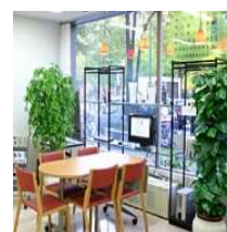
R & Bパーク 札幌大通サテライト