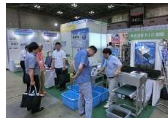
釧路工業技術センターと地域水産関連機械メーカーによる『インターナショナルシーフードショー』出展