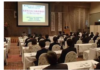
室蘭におけるフロンティア技術検討会「ものづくり現場での高齢者雇用について」