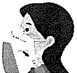
②あご下まで伸ばし顔に すき間なくフィットさせる