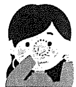
①鼻の形に合わせ すき間をふさぐ