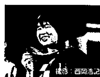
全日本選手権大会で、日本記録を樹立