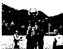
競技団体のユース選抜や育成・強化選手に選出