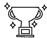
4名が東京2020パラリンピック競技大会出場