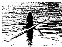
JOC エリートアカデミーに入学し、海外遠征などに参加

J-STAR 修了後、有望選手は、各中央競技団体の強化・育成コースに選出。オリンピック、パラリンピックをはじめ、世界で活躍できるトップアスリートを目指すために引き続きトレーニングを重ねていく機会が得られます。