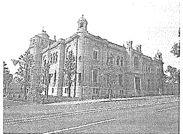
【日本銀行旧小樽支店】