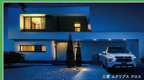
三菱 エクリプス クロス 災害などの停電の備えに PHEVによる家電への給電のしくみについて