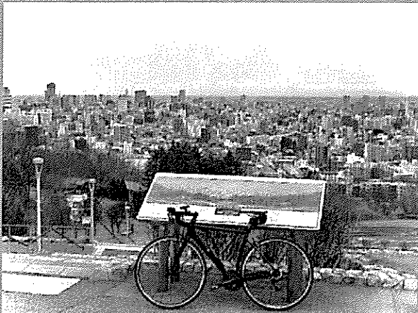
札幌の街並みを見下ろせる旭山記念公園