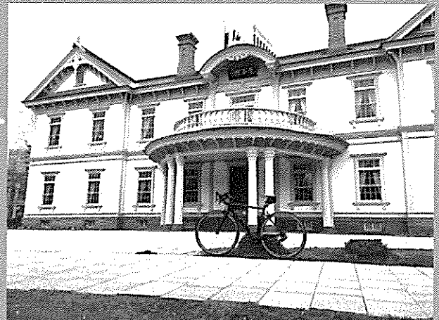
中島公園にある豊平館