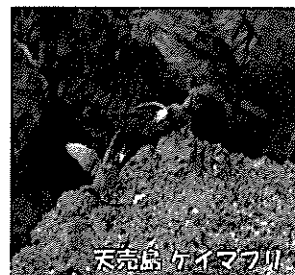
利尻島 ケイマフリ