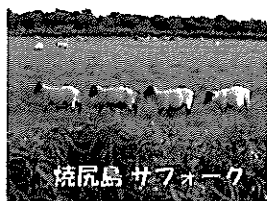
利尻島 サフローウ