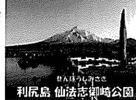
利尻島 仙法志御崎公園