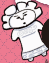
応援キャラクター「トリーくん」