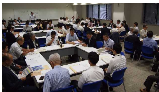
↑北海道フォーラム設立記念講演 第2部グループ討議 (2018.8.22@北海道大学)