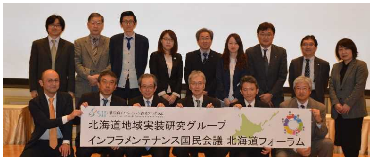
↑SIPグループと北海道フォーラムとの引継ぎ -フォトセッション- (2019.3.4@OMO7旭川)

2019年3月をもって、SIPグループは研究活動期間を終えるため、地域実装への取組みを、北海道フォーラムが引き継ぐこととして、引継ぎの意を込めてフォトセッションを実施しました。