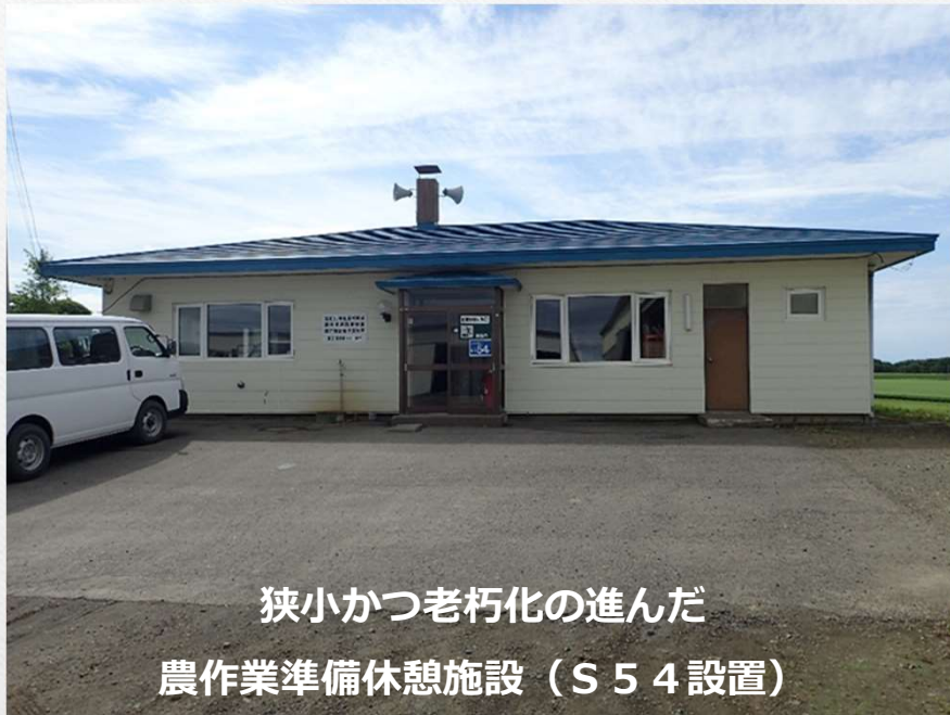
狭小かつ老朽化の進んだ 農作業準備休憩施設（S54設置）

※農作業準備休憩施設：農作業の準備や打合せ、肥料・農薬等の発注納品業務や保管、農家等の休憩場所として利用。