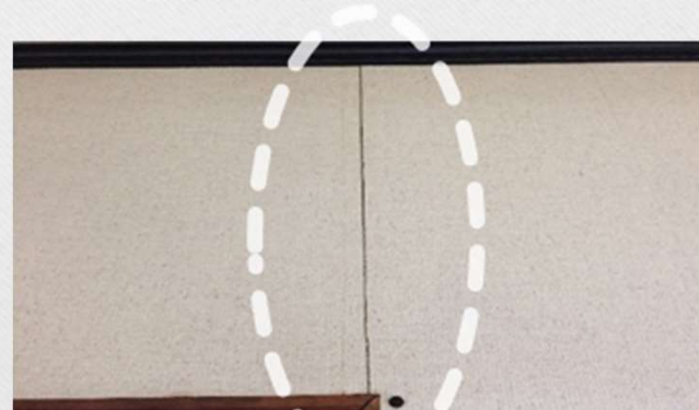
雨漏りやクラックが生じ 維持管理に限界がきている。