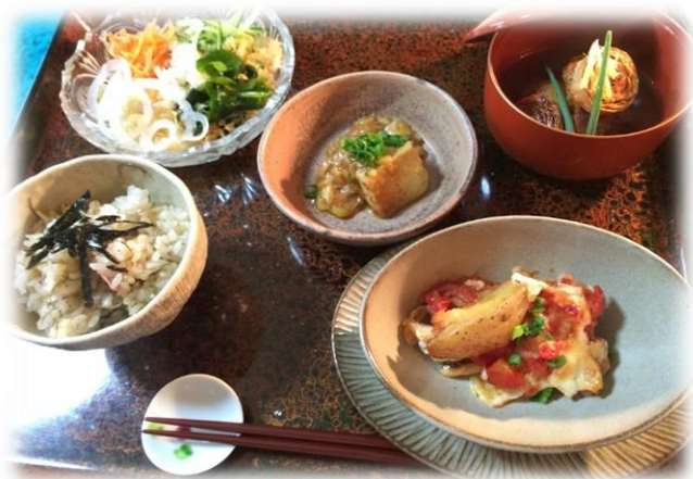
オホーツクの有機野菜と水産物をコラボした高齢者向用食品