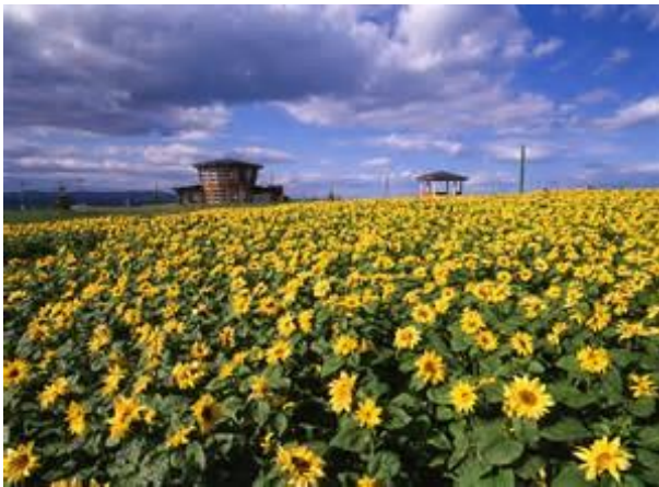
日の光をうけるメルヘンの丘公園のひまわり

いた産業間の連携にとどまらず、他地域への有機農業の普及・推進や、流域間での連携などに積極的に取り組んでいる。