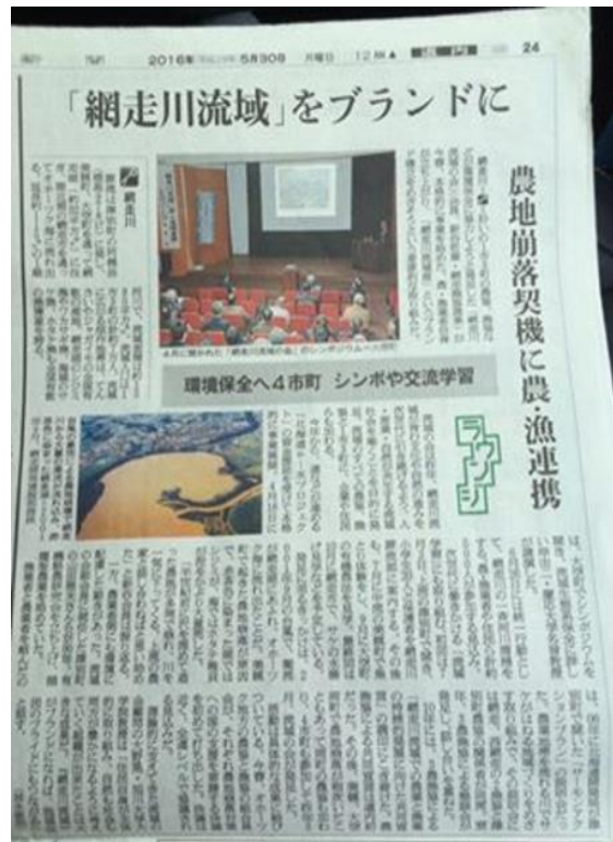
「網走川流域の会」を伝える新聞記事（網走川流域の会ブログより）

も、濃厚飼料の原料となるデントコーンも、乳牛が口にするエサはすべて有機。そこから絞られる牛乳は、「明治オーガニック牛乳」として販売されている。これは、