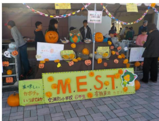
自らが育てたかぼちゃを自ら販売。子どもたちの声が響く「輝農祭」

子どもたちは自分たちが収穫 したかぼちゃを元気良く売る。 「どう話したら売れるか」「自分 たちの商品の魅力は何か」を自分 自身に問いかけながら、一生懸命 販売を行う。