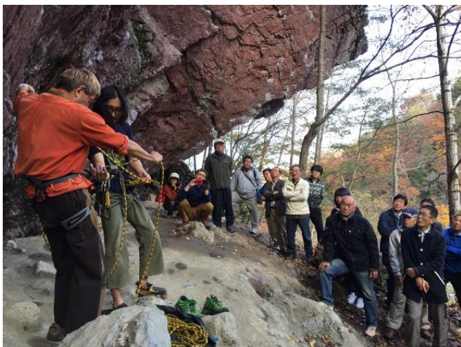
赤岩青巖峽は全国のクライマーを惹きつける

は国の地域づくりの助成を受けるために、地域活動のプレーヤーを再編集した組織で、活動はこの協議会の前からあり、現在もさまざまな組織や仕組みを使いながら続いています。2017年には流域の未来にとつて次のステップに進むべく「鵜川135ビジョン」の準備をしています。地域活動は生き物ですから継続する資金も必要ですが、それ以上に活動する人々の「気持ち」が大切です。多くの地域活動はボランティアな気持ちと行動によって支えられていますので、楽しくなければ続きません。そして、小さな地域では人間関係がもつとも大切で、何かの目的達成のためにこれが壊れてしまうようでは、その後の損害は計り知れないのです。「無理せず、楽しく、そこそごキゲン」が重要です。