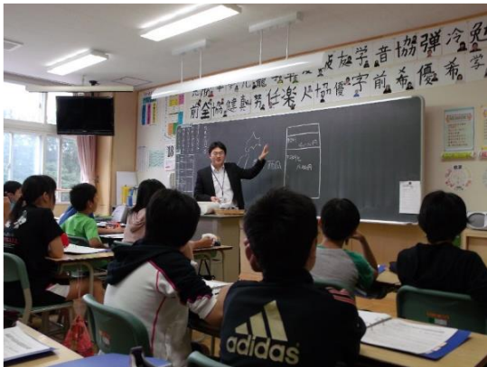
「値段の決め方」を学習中