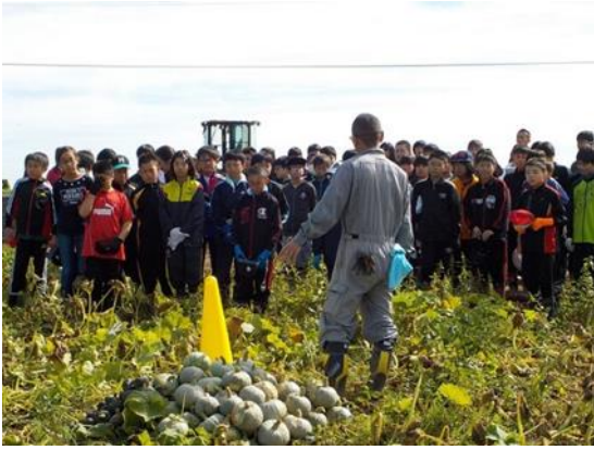
一年間育てた成果。「次は輝農祭で販売だ！」