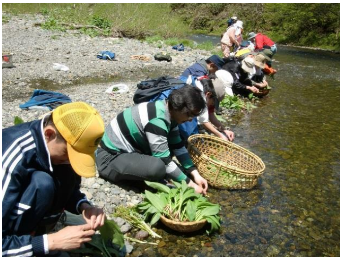
山菜市のワークショップ ギョウジャニンニクを川で洗う

私たちの活動は、人間だけの活動だとは思っていません。私たちは鵜川流域の大きな森と大きな水の循環の中で生かされている大自然の一部です。森の木々や、ヒグマ、エゾシカなどの動物や鳥、小さな虫や魚も同じ地域で暮らしている仲間です。こうした自然の循環をどうやって守って