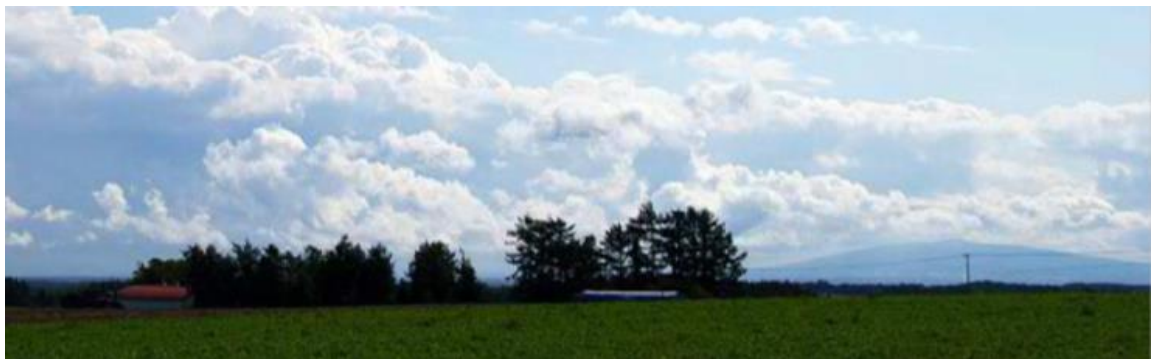
藻琴山（標高1000m）を背景にした「有機農業」実践ほ場（協議会ホームページより）