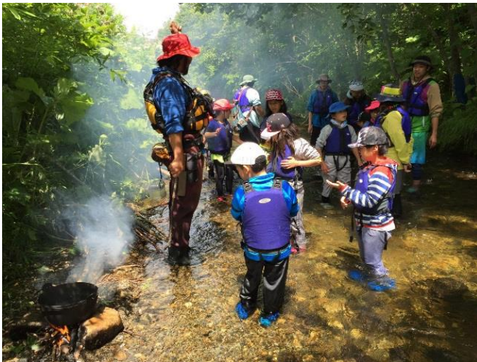
地域の小学校で行われている川遊び授業

住民がさまざまな場面で顔を合わせて、多様な「課題」について話し合い、その都度行動していく。これは自治の原点とも言えるべき行動で、ここでいう課題は地域にとっては重要な「資源」です。課題がなければ自治やコミュニティは育ちません。この課題に、住民がしなやかに楽しみながら対応していくこそが地域づくりです。