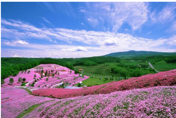
ピンクの稜線がオホーツクの春を彩る芝桜公園

里岳も間近に見え、遠くは阿寒連山を望む絶好のロケーション。そんな日進地域は、戦後の農地開拓事業により、痩せた火山灰地を切り開いた広大な農地が広がり、畑作三品（麦・甜菜・じゃがいも）を中心とする輪作体系が確立され、戸あたりの経営面積は30 haを超える大規模畑作地域となっている。