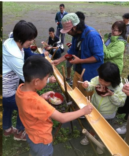
小水力エネルギーを楽しく学ぶ