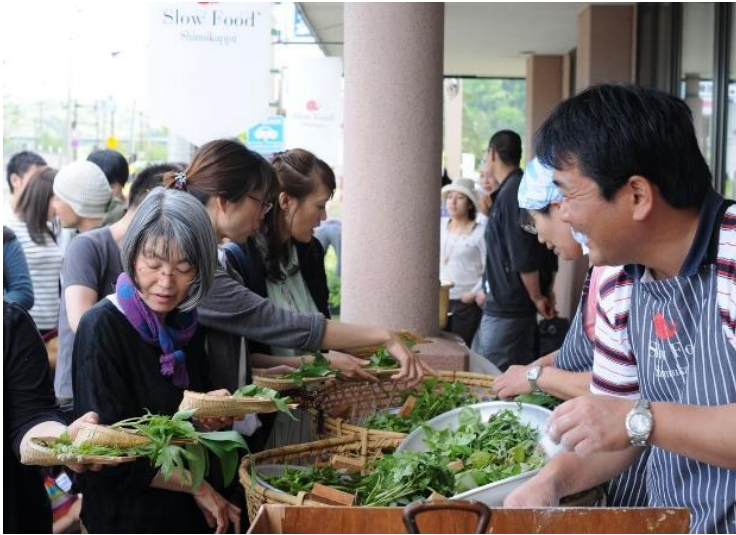
「山菜市」は全道のボランティアで運営される

「山菜採り文化」のノウハウを学び、夜の交流会では山菜料理を通じて、地域の人と交流している。平成28年5月29日、今年も道の駅しむかっぶの山菜市会場は多くの人で賑わった。スタッフには村の人たちのほか、各地から集まったワークショップの参加者も加わっている。