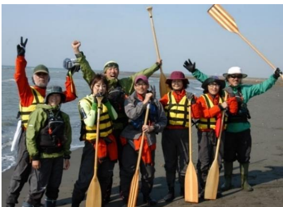
源流から海へ135kmを下るツアー（鵜川河口）

小さなこの村で始まった取組は、地域活動の潤滑油として役割を果たし、人々の生き方や暮らしの原点を教えてくれているようだ。