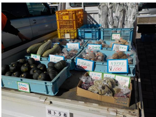
有機農産物を満載した輝農祭名物「軽トラ市」

海や川には鮭がのぼり、里では 収穫を喜ぶ十月中旬、人々は道の 駅「メルヘンの丘女満別」に山海 の幸をもとめて集う。