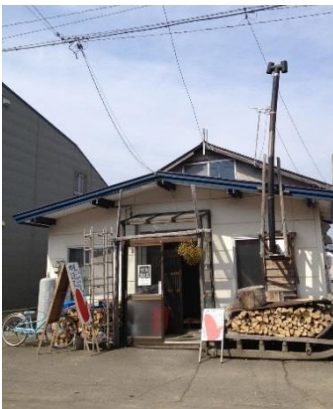
地域カフェぼっこてぶくろ

ブログやSNSを活用し、人目を引くインパクトとセンスの良さにこだわり、「行ってみたいな」と思わせるような情報発信を心がけている。すると徐々に「ぼっこてぶくろ」や「村民食堂」に訪れる人は増え始め、今では、ロコ