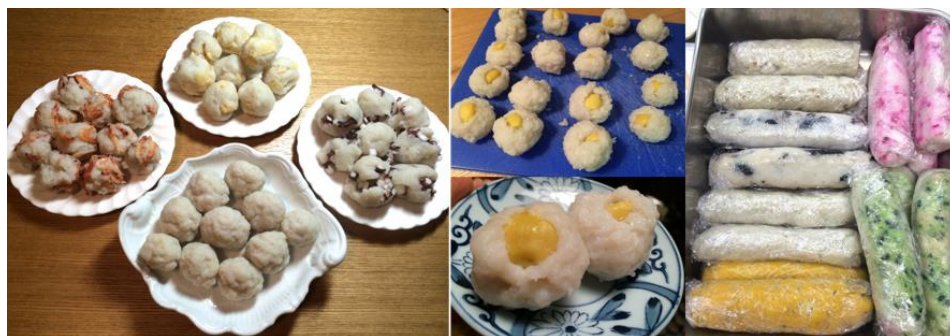
試作したかまぼこの数々。「大地のMEGUMI」と「朝倉商店」との連携により、新たな「かまぼこ」 が生まれる

輝農祭の開催に当たっては公 的な支援は得ず、企画や運営は自 らが行う。祭りの会場には遠く関 西地方から運営のためにやって くる。「つながり」が生んだ成果 は、祭りを通じて次の「つながり」