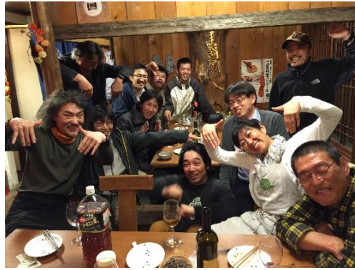
楽しい場所には多彩な人材が集まる 「鵜川の落差工を考える住民会議」

もちろんこれは行政にも求められる能力ですが、行政は担当者の能力にかかわらず、予算化してその議決がないと動けませんし、公平性が常に求められ、縦割りで融通がききません。これらは安定的な行政運営を行うには大切なプロセスでもあるので仕方がないことです。しかし、これでは行動するまでに時間がかかりすぎます。