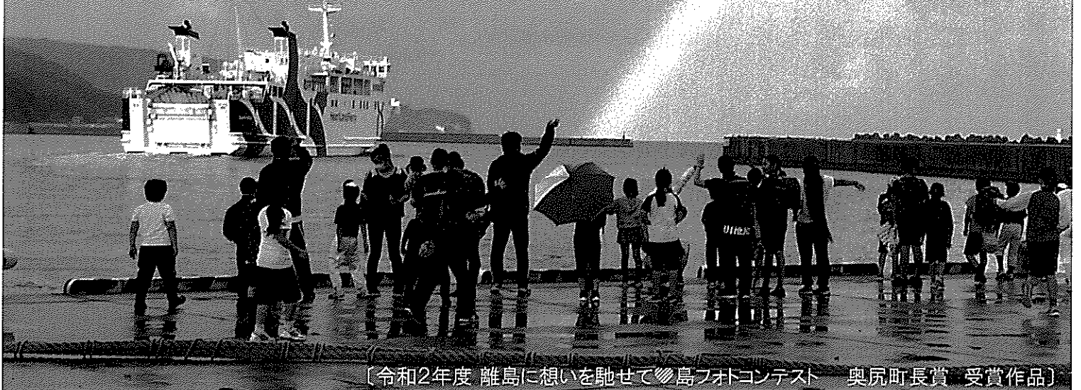
〔令和2年度 離島に想いを馳せて島フボコンテスト 奥尻町長賞 受賞作品〕