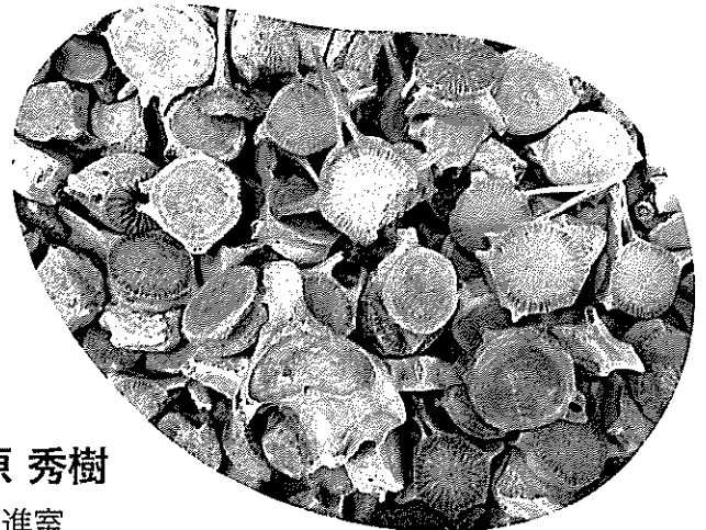
■入江貝塚 海棲哺乳類の椎骨