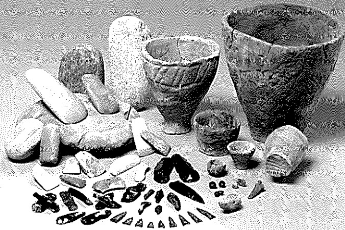
北海道八千代A遺跡出土品

帯広市図書館 1階多目的視聴覚室【定員30名(要事前申込み)】 (帯広市西2条南14丁目3-1) 主催:北海道