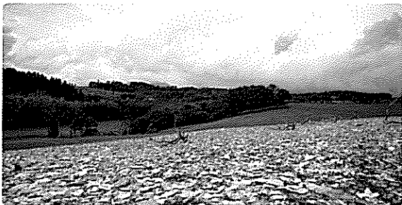
■北黄金貝塚 ※JOMON ARCHIVES (伊達市教育委員会所管)