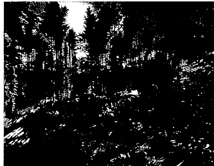
【一般の部】山を 護り 繁く 職人の業

〈撮影者コメント〉 作業員さんの表情とフォワーダの機能を撮れたので、とても良い写真だと思っています。