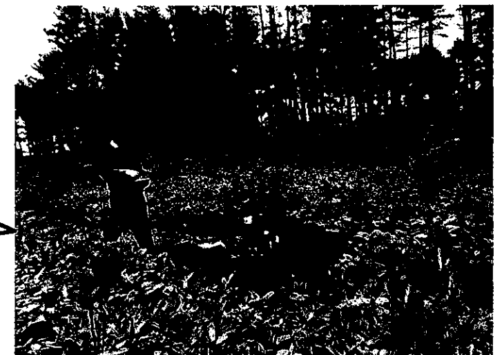
【学生の部】進め！スマート林業