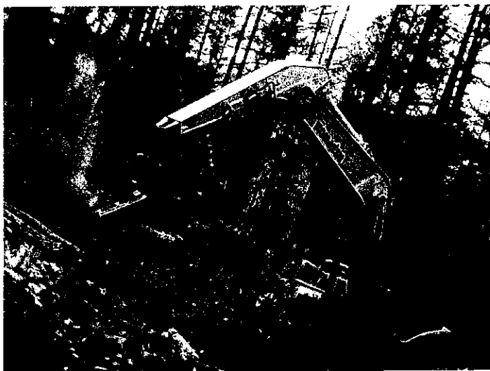
【学生の部】俺に任せて！ 撮影者：小幡 主真さん [帯広農業高校]

〈撮影者コメント〉 十勝ならではのカラマツ防風林を背に、 すばやく伐採し枝払いから玉切りま での一連の作業を、あっという間に 行う迫力に感心しました。