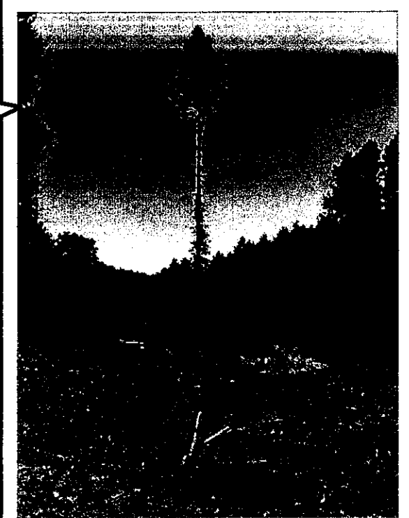
【学生の部】最後の木 撮影者：宮里 風介さん [旭川農業高校]